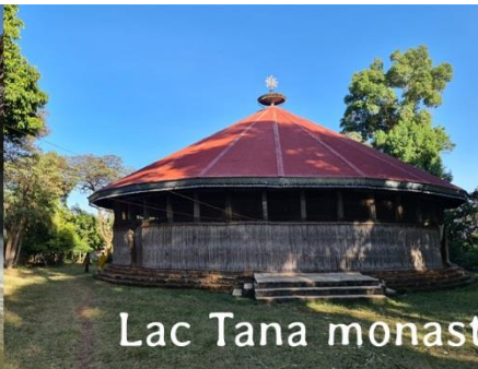
Lac Tana monastère